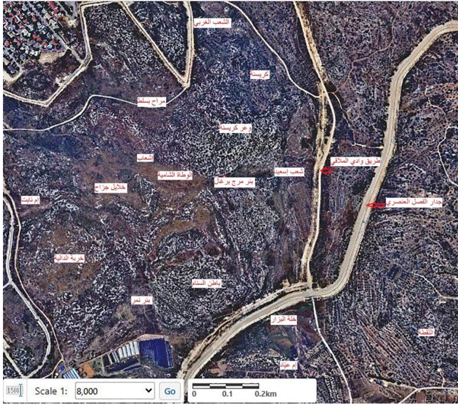
صورة 3: أسماء المناطق للمرتفع الذي دارت عليه المعركة. المصدر: جيومولج بتصريف من الباحثين.