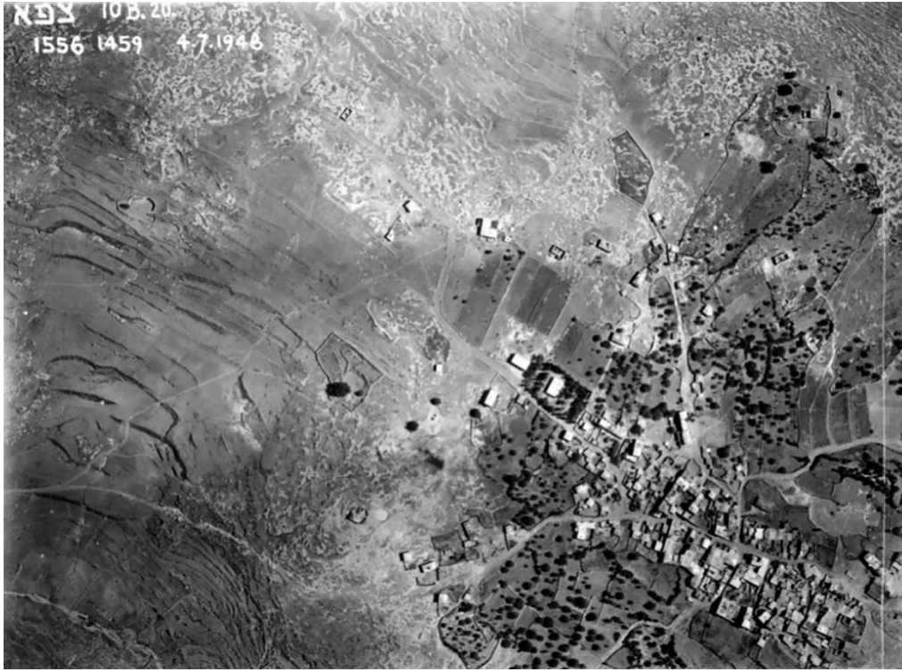
صورة 1: قرية صفًا عام 1948.